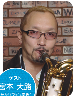
ゲスト 宮本 大路 (サクソフォン奏者)