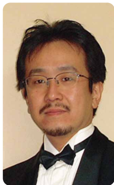
合奏指導・指揮 水口 透 (作・編曲家、指揮者)