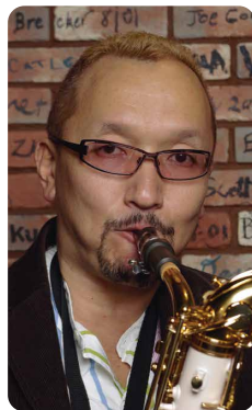
ゲスト 宮本 大路 (サクソフォン奏者)