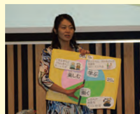
第2回セミナーの様子 (上)お金ってたいへん (下)クイズだぜイ!