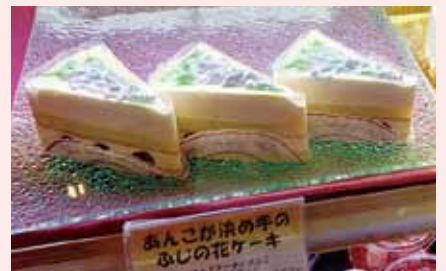
実際に販売したケーキ

昨年の第3回親子マネー講座ではチーム(会社)で企画した中から1つが実際に市内のケーキ屋にて商品化され販売されました。