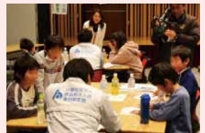
昨年度 第3回セミナーの様子

今回の親子マネー講座は、みんなで会社を作り、ケーキ販売の企画を行います。最優秀のケーキは実際にお店で販売されます。